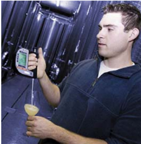
DMA 35 Dichtemessgerät

Um bei der Weinproduktion eine hohe Qualität zu gewährleisten, ist es notwendig, den Gärverlauf kontinuierlich zu kontrollieren. Nur durch die tägliche Kontrolle der Dichte bzw. des Mostgewichtes und der Temperatur ist es möglich, bei Bedarf sofort in den Gärverlauf einzugreifen und so sicherzustellen, dass eine möglichst schonende Vergärung stattfindet.