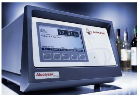
Bild: Alcolyzer Wein

Die von Anton Paar patentierte Methode zur Alkoholbestimmung mit dem Alcolyzer Wein basiert auf Nahinfrarotspektroskopie in einem hochgradig alkoholspezifischen Bereich. Die Alkoholbestimmung von Weiß- und Rotweinen, sowie von süßen und trockenen Weinen kann mit derselben Justierung durchgeführt werden! Der Bereich des Spektrums zwischen 1150 und 1200 nm ist hochspezifisch für Alkohol. Umfassende Untersuchungen haben gezeigt, dass die Alkoholresultate, basierend auf dieser Auswertung, praktisch unbeeinflusst von anderen Bestandteilen im Wein sind. Der Alcolyzer Wein ist produktunabhängig und kann daher ohne arbeitsintensive Kalibration eine breite Palette an Anwendungen abdecken. Es reicht