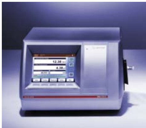
Bild: DMA 5000 M Dichtemessgerät

Die Bestimmung des Alkoholgehaltes von Alkohol-Wasser-Mischungen mit Hilfe der Dichtemessung wird weltweit in Gewerbe und Industrie sowie von Zoll- und Steuerbehörden durchgeführt. Während bis vor einigen Jahren die Dichte, die Relative Dichte oder das Spezifische Gewicht mit speziellen Spindeln (Alkoholometer, Aräometer, Hydrometer) oder mittels Pyknometer auf sehr aufwendige und zeitraubende Weise durchgeführt wurde, werden heute aufgrund der höheren Genauigkeit, Verlässlichkeit und Geschwindigkeit meist digitale Dichtemessgeräte nach dem Biegeschwingerprinzip verwendet.